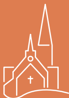
Evangelische Auenkirche Berlin

Tel. 030 – 40 50 45 34-0 www.auenkirche.de